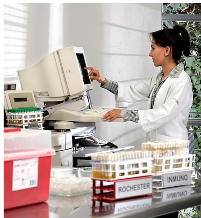
La confiabilidad de los exámenes es garantizada por controles internos y externos.