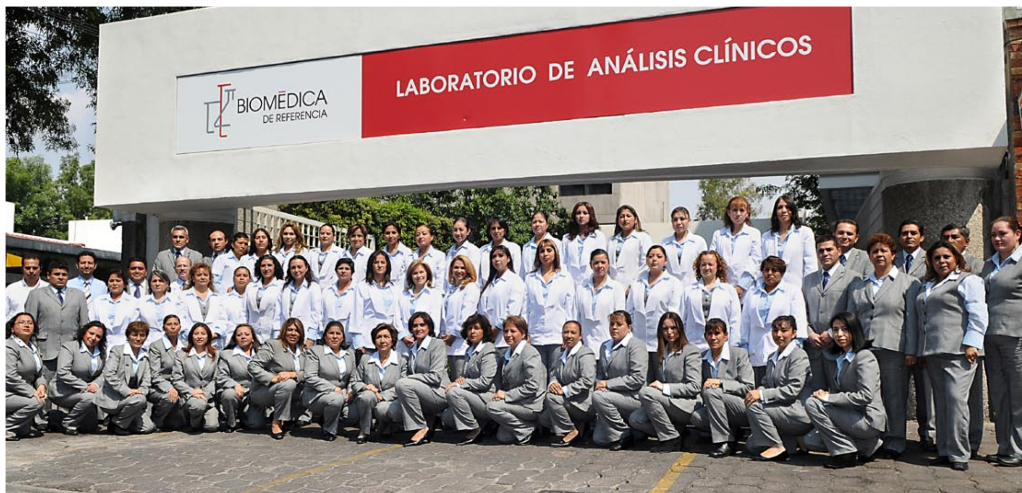
Grupo de colaboradores de Biomédica de Referencia.