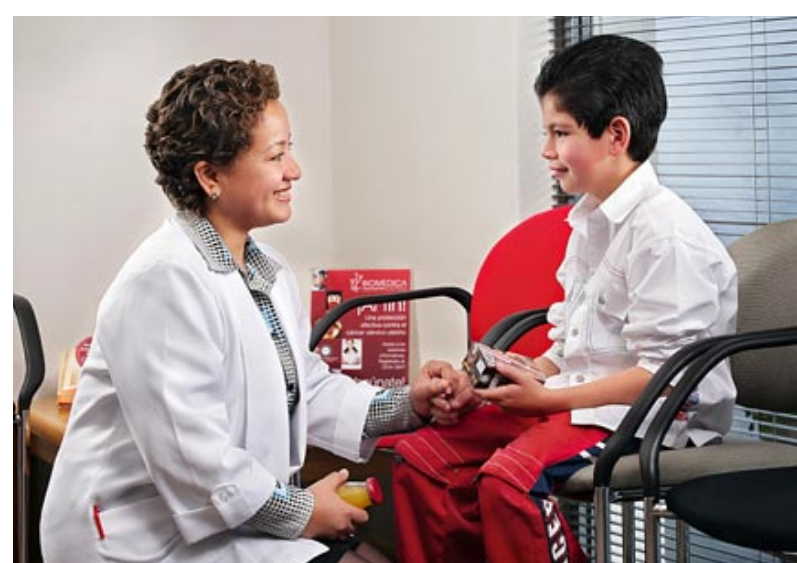
La calidad también se refleja en el trato que dan a todos sus clientes.