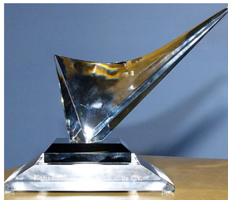
Premio Nacional de Calidad obtenido por Biomédica de Referencia.